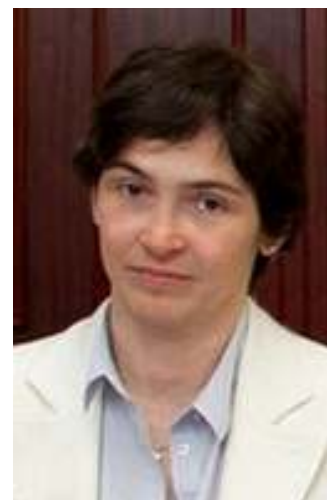
Изабель да ла Мата Помощник по специальным вопросам в здравоохранении Генерального директората по здравоохранению Еврокомиссии