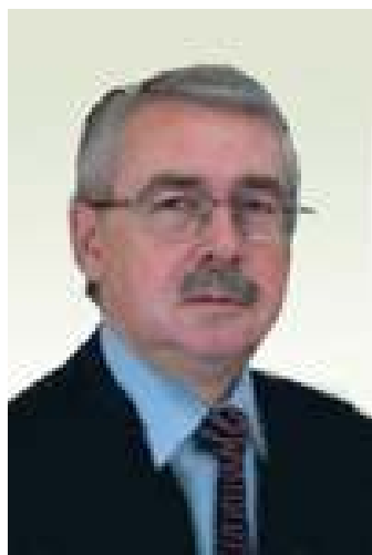
Дубов Иван Иванович Директор Департамента международного сотрудничества Минздравсоцразвития России