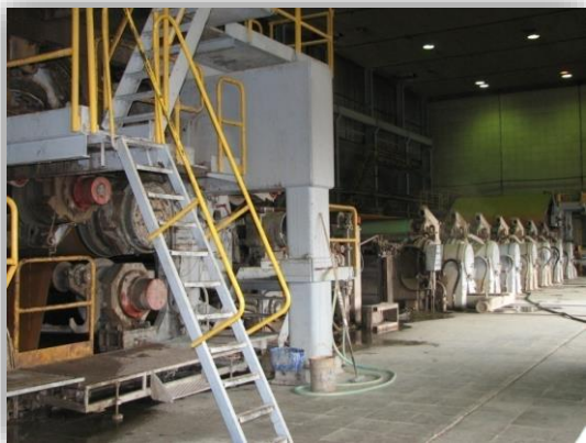
Картоноделательная машина KM1