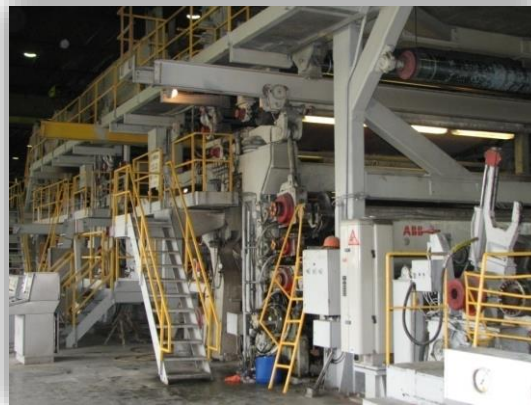
Картоноделательная машина KM2