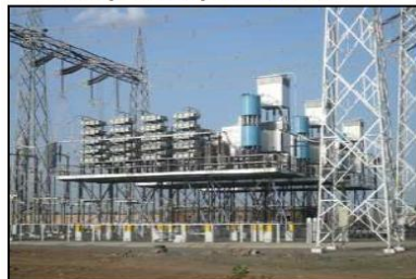
Сектор электросетей Alstom