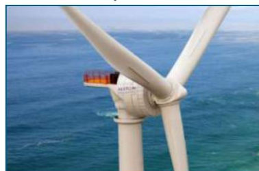
Сектор возобновляемых источников энергии Alstom