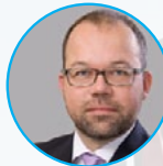
Йорг Бонгартц Deutsche Bank Председатель правления