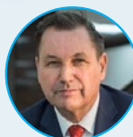
Бу Андерссон Автоваз Президент