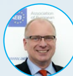
Франк Шауфф Ассоциация европейского бизнеса (АЕБ) Генеральный директор