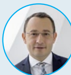
Ойген Аллес Мессе Франкфурт РУС Генеральный директор