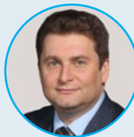
Александр Морозов Минпромторг России Заместитель Министра