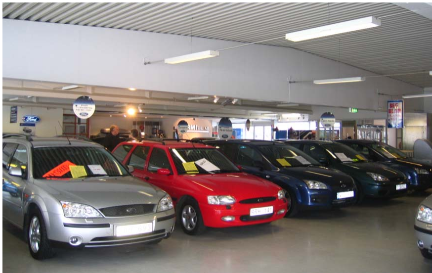
НАПРАВЛЕНИЕ ДЕНЕЖНЫХ ПОТОКОВ И БЮДЖЕТНЫЕ ПОСТУПЛЕНИЯ ПРИ РАЗЛИЧНЫХ СХЕМАХ ПРОДАЖИ АВТОМОБИЛЕЙ