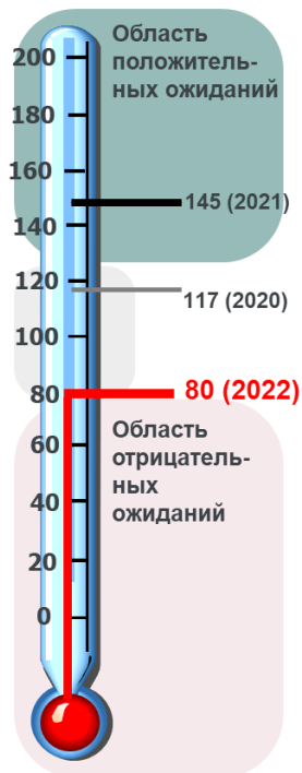
АЕБ индекс, 2022

Текущая ситуация оказала негативное влияние на оценку комплексного индекса АЕБ. Индекс упал до рекордно низких за всю историю исследования оценок (80 баллов из 200 возможных, 145 баллов в прошлом году). Зафиксировано снижение всех 9-ти составляющих Индекса, описывающих текущее состояние и ожидания бизнеса.